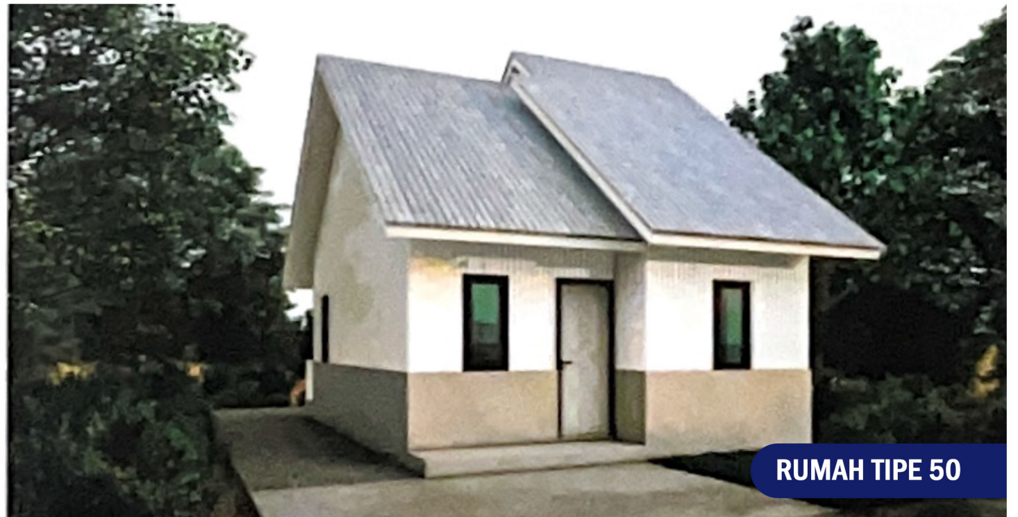
RUMAH TIPE 50