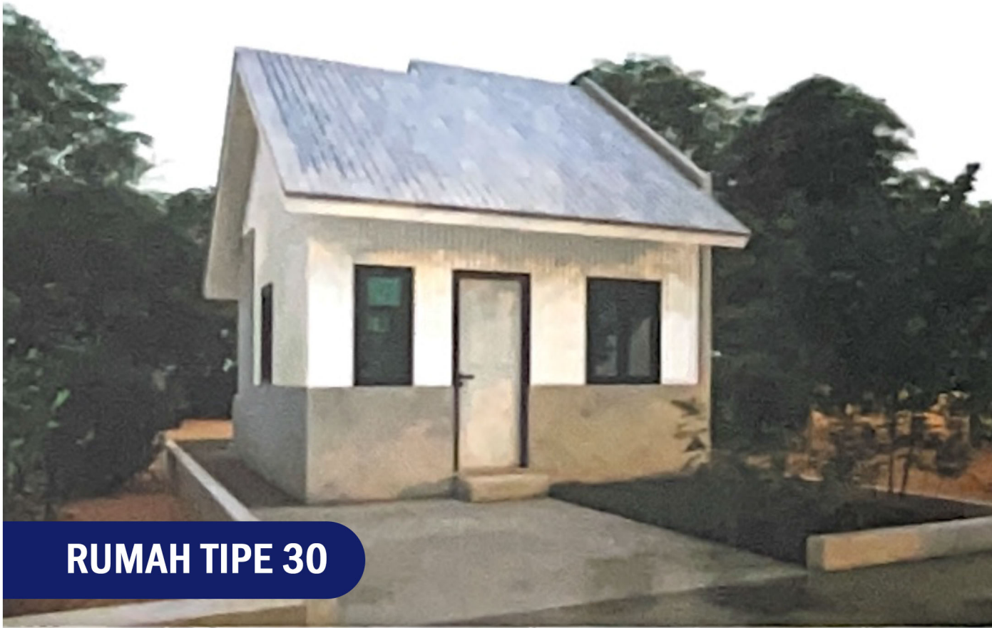
RUMAH TIPE 30